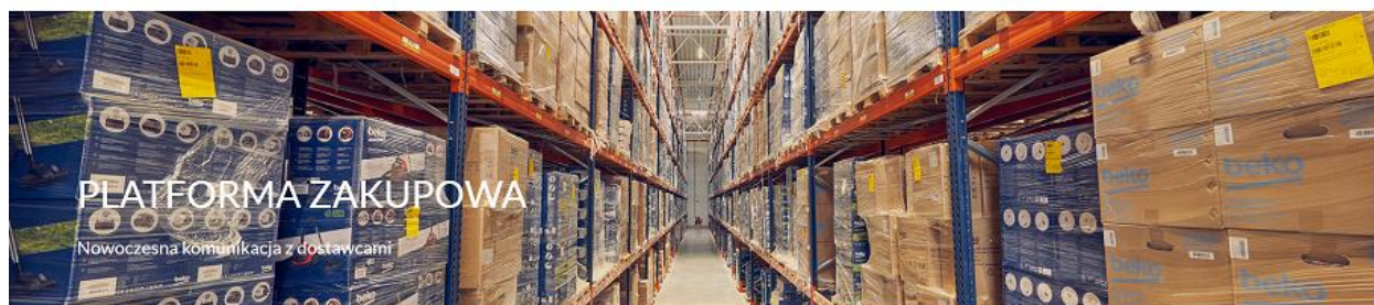
Rysunek 7 Logowanie na platformie