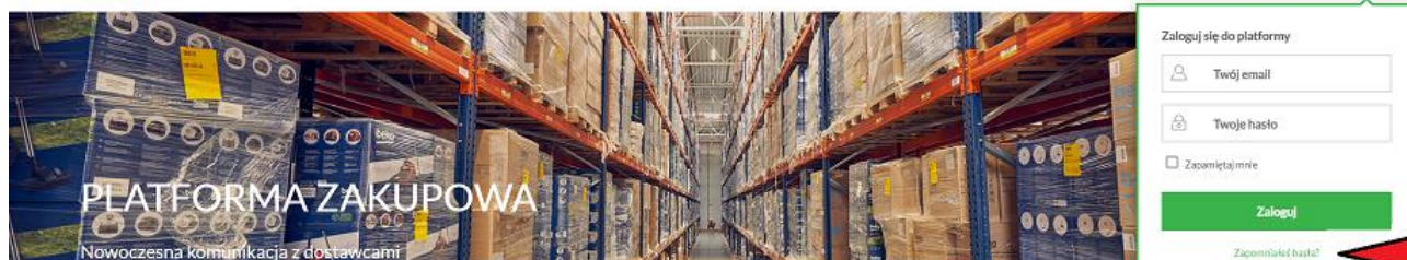
Rysunek 9 Nie pamiętam hasła