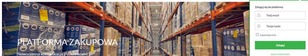
Rysunek 8 Uzupelnianie loginu i hasła